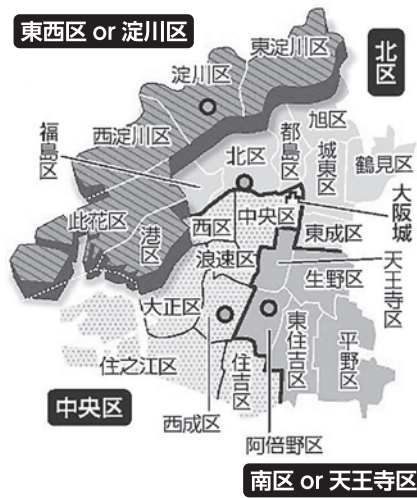
大阪府分割案（○は区役所の位置）

「大阪都」は、大阪市を廃止して4つの特別区に分割するものです。「大都市地域特別区設置法」で「市の廃止」とはつきり。市のホームページでも維新が都構想と呼ぶ内容に「大阪市をなくし特別区を設置」と明記。