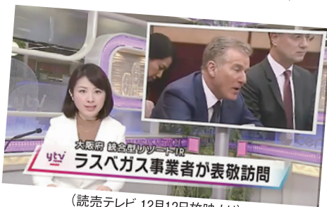
(読売テレビ 12月12日放映より)