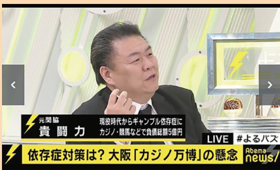
(AbemaTV/『みのもんたのよるバス!』より)