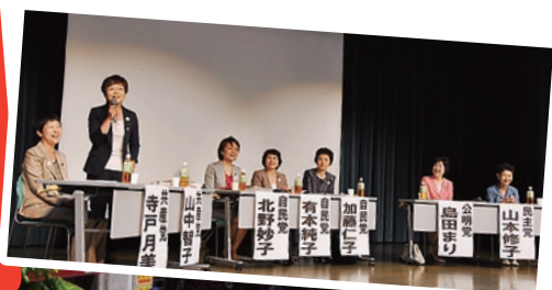
▲9日、超党派の女性の女性が開いた集会(自民、公明、民主、共産の現・前市議)