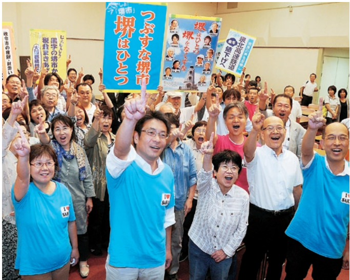
2013年の堺市長選挙では、「つぶすな堺、堺はひとつ」の声のもと、共同の輪が広がりました

くらし破壊、大阪破壊の「維新」の暴走ノー！、「大阪都」ストップへ、共同の流れが大きくすすんでいます。