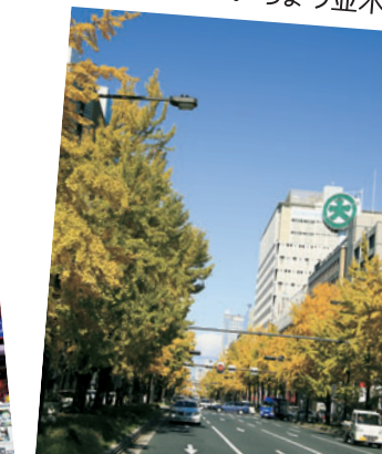
御堂筋のいちょう並木