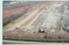
北ヤード開発 超高層ビルより 文化施設、緑地公園に