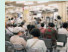
区役所に20数万人の市民が殺到。 住民税や国保の増額に抗議。