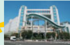
アート系NPOなどが 活動中のフェスティバル ゲートを市が閉鎖に。