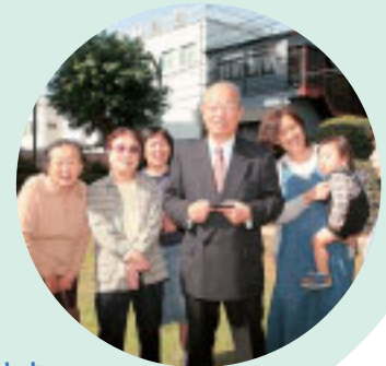
「平野郷」 歴史ある町並みを守ります