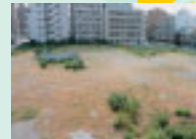
「同和」の未利用地 市営住宅などの 建設に