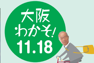
姫野浄の 駆けあえる記