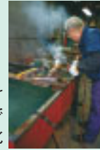
中小企業向け 予算の増額で 大阪経済の活性化