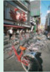
道頓堀に多数の放置自転車。商売に影響も出て通行も危険。