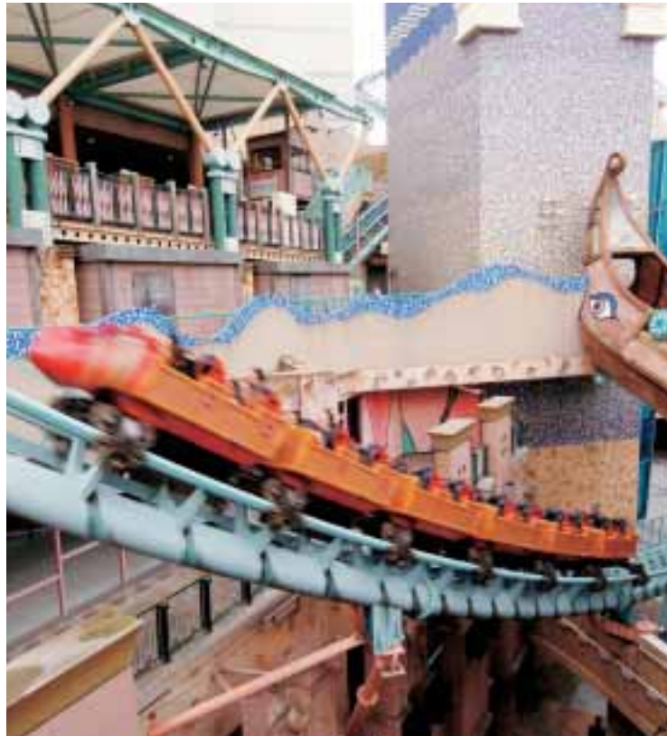
フェスティバルゲート