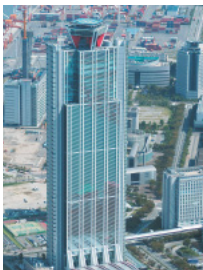
二次破たんが予測される市役所の 第二庁舎 ワールドトレードセンター