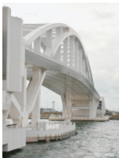
訓練以外に一度も回転したことのない 635億円の橋 夢舞大橋