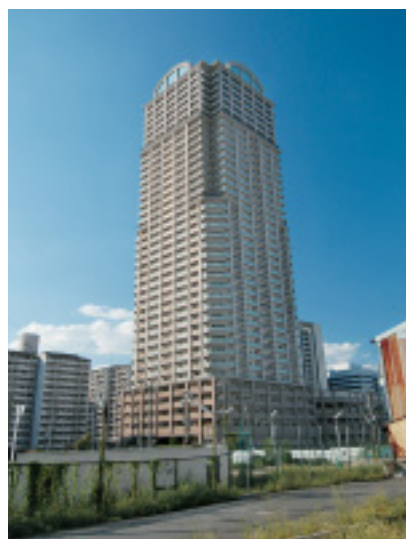
2100億円の大赤字 阿倍野再開発事業

大阪市の財界・オール与党と二人三脚で多くの大型開発事業に取り組み、そのすべてで失敗。膨大な不良債権の山を築いてきました。しかし、歴代市長も市幹部もなんの責任も取らず、高給をもらい続け、高額な退職金を受け取っています。まったく許せません。